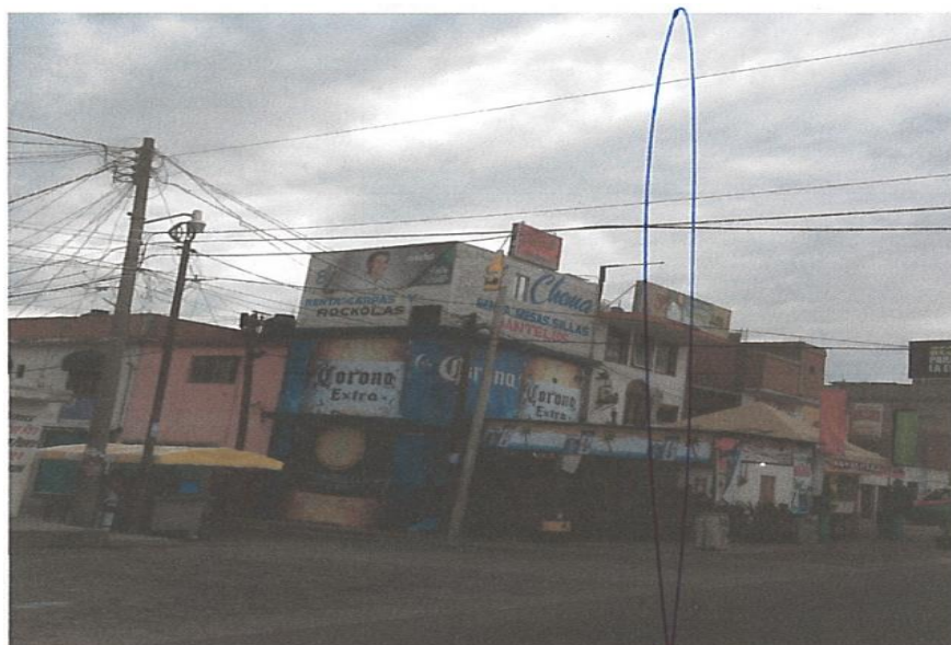
Publicidad ubicada en Calle Durango esquina con Av. Mariano Balleza, Zona Centro Dolores Hidalgo C.I.N., Gto.