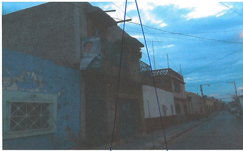
Publicidad ubicada en Calle Nayarit #16, Zona Centro Dolores Hidalgo C.I.N., Gto.