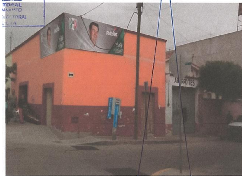
Publicidad ubicada en Calle Zacatecas esquina con Av. José Alfredo Jiménez, Zona Centro Dolores Hidalgo C.I.N., Gto.