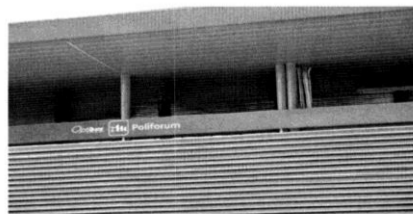
Fotografía tomada en el paradero denominado Poliforum (Anexo 16)