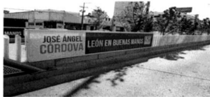
Valla con propaganda electoral del Partido Verde Ecologista de México. (Anexo 19)