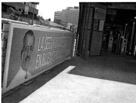
Torniquete con propaganda electoral del Partido Nueva Alianza. (Anexo 104)