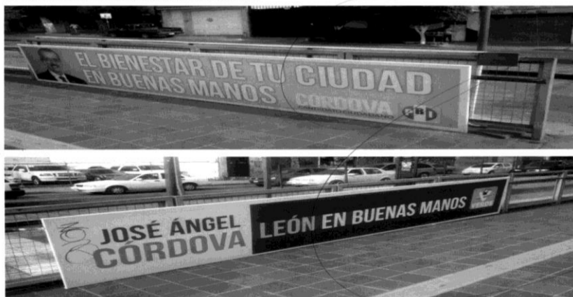
Fotografía Particular de cada Valla a retirar:

Para corroborar lo anterior, se plasman en esta sentencia, a manera de ejemplo, algunas de las imágenes, correspondientes a los hechos denunciados, donde en todo momento se aprecia la actuación individual de cada uno de los partidos políticos denunciados.