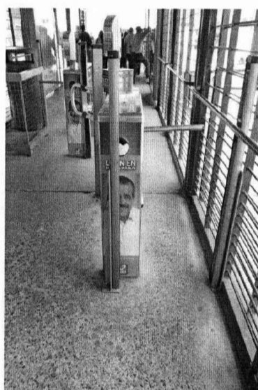
Torniquete con propaganda electoral del Partido Revolucionario Institucional. (Anexo 111)