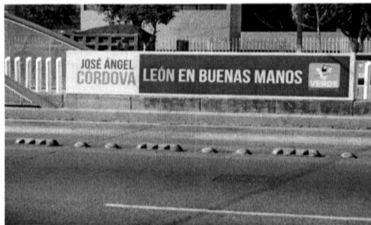
Valla con propaganda electoral del Partido Verde Ecologista de México. (Anexo 20)