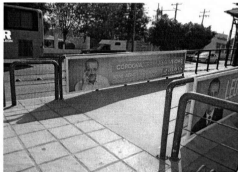
Valla con propaganda electoral del Partido Revolucionario Institucional. (Anexo 15)