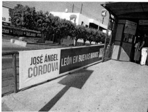
Valla con propaganda electoral del Partido Verde Ecologista de México. (Anexo 26)