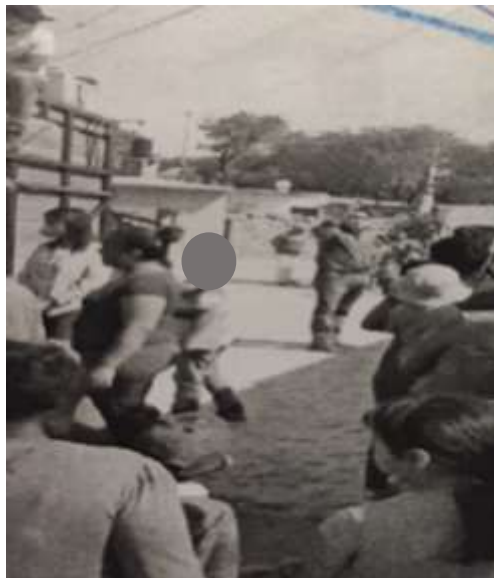
IMAGEN REPRESENTATIVA 46

[...] Se aprecia sobre una calle aproximadamente veinte personas en forma de círculo entre hombres, mujeres y niños, se encuentra un camión de redilas de madera, en la parte de arriba del camión se encuentra una persona del sexo masculino que viste pantalón de mezclilla azul, camisa blanca, cachucha negra y un cubre bocas colore azul, asimismo se percibe que arriba del camión se encuentran varias cajas de cartón color café claro, en la parte de en medio se percibe una persona de sexo masculino, estatura regular, complexión regular, que viste un pantalón de mezclilla azul claro, camisa verde y un cubre bocas verde, quien se encuentra levantando el brazo. [...]